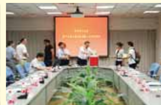
第十五届工会委员会第一次全体会议