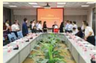
第七届教代会执委会第一次全体会议