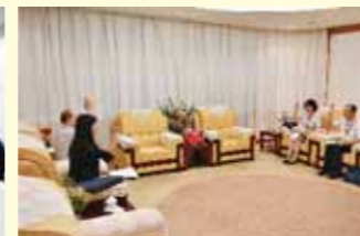
第十五届工会经费审查委员会第一次全体会议