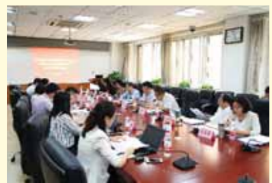
代表团讨论大会报告