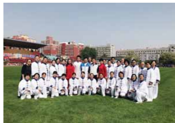
(教工太极拳爱好者协会)

在学校2018年运动会开幕式太极拳表演‘八法五步’展示完毕后，太极拳协会成员还意犹未尽，纷纷摆出太极pose合影留念，或棚、或掙、或挤、或按、或採、或捌、或肘、或靠，翩翩起“武”，韵味十足。通过本次太极拳表演的展示，我们北师大又吸引了新一批太极拳爱好者。