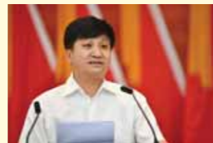
北京市总工会副主席张青山致辞