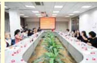
第六届女教职工委员会第一次全体会议