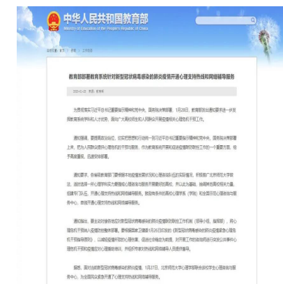
教育部推广北师大防疫做法