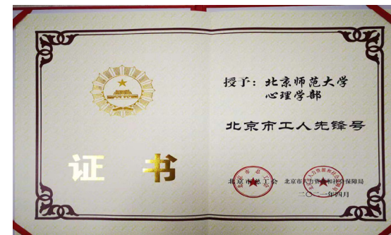
心理学部获北京市工人先锋号

事迹入选教育部思政司《高校党组织战“疫”示范微党课》，一人获北京高校优秀共产党员，一支部获北京高校先进党组织，一人在抗疫一线“火线入党”。心理学部党委荣获“北京市抗击新冠肺炎疫情先进集体”“北京市先进基层党组织”，并在 2020 年 9 月 29 日隆重举行的北京市抗击新冠肺炎疫情表彰大会上受到表彰。