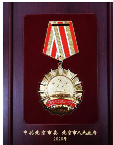
北京市先进工作者