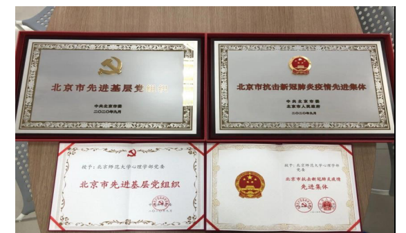
心理学部获北京市抗疫先进集体、先进党组织证书