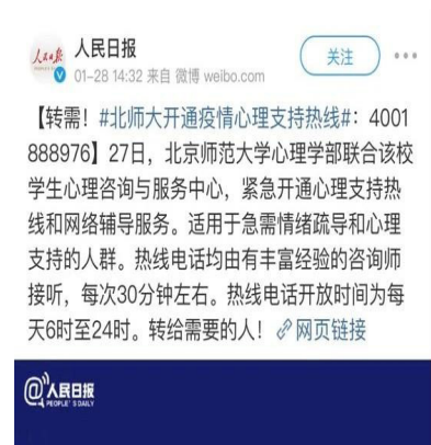
人民日报报道心理学部战疫