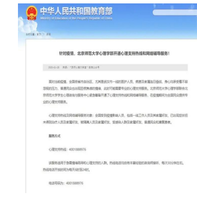
教育部报道心理防疫热线