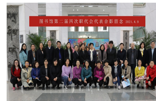
图书馆第二届四次职代会代表合影留念