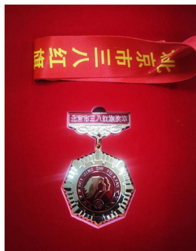
北京市三八红旗奖章

北京师范大学心理学部是国家世界一流心理学科建设单位，唯一一个心理学一级学科国家重点学科单位。在教育部学科排名中，心理学科连续排名全国第一，在 2016 年公布的排名中，北师大心理学科位列 A+；“精神病学与心理学”和“神经科学与行为科学”进入 ESI 世界前 1%；在 QS 世界大学学科排名中，北师大心理学科进入全球前 100 名。