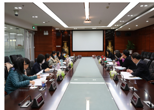
第一代表小组分组讨论情况

在分组讨论中，代表们结合会议报告，重点对图书馆“十四五”规划、内部治理体系建设、环境设施完善、职代会与工会工作创新等议题进行讨论，提出了很好的意见和建议。