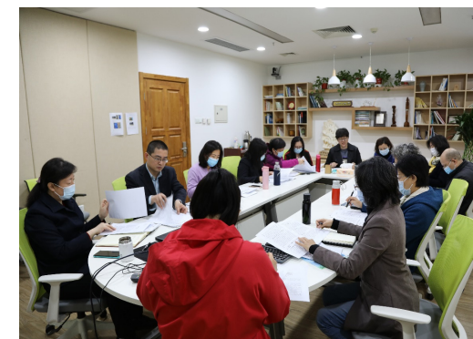
第二代表小组分组讨论情况