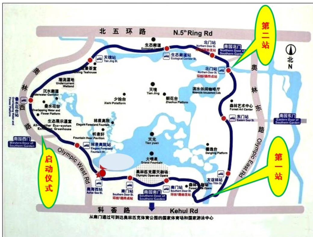
奥森公园南园平面图

启动仪式：11月4日上午9:00，“廉洁奥运主题文化园”雕塑 (站点在西门安检处左前方，有北师大校旗及健步走横幅标识处)